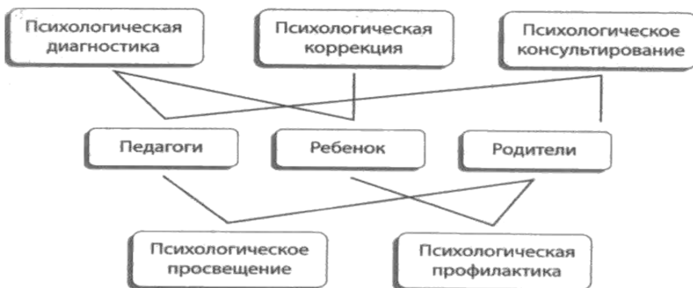
Схема психологического сопровождения участников образовательного процесса представлена на схеме.

Для выполнения должностных обязанностей педагог-психолог использует отдельный кабинет, помещения групп, музыкальный/физкультурный зал.